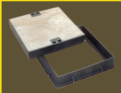
เติมวัสดุ (Infill)