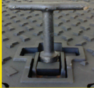
ระบบล็อก (Lock)