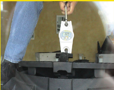
น้ำหนักเบา (Lightness)